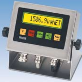
Option: Anzeigergerät IT 1000 (Ausführung Edelstahl IP67)