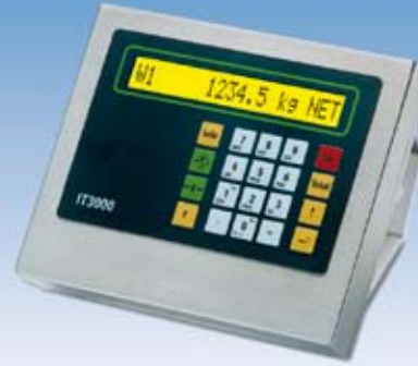
Option: Anzeigergerät IT 3000 (Ausführung Edelstahl IP67)